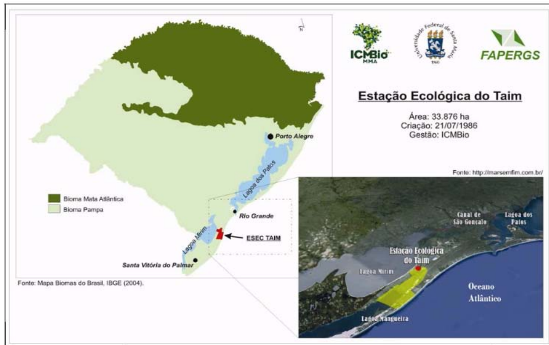
Figura 1 - Localização Espacial da ESEC Taim.