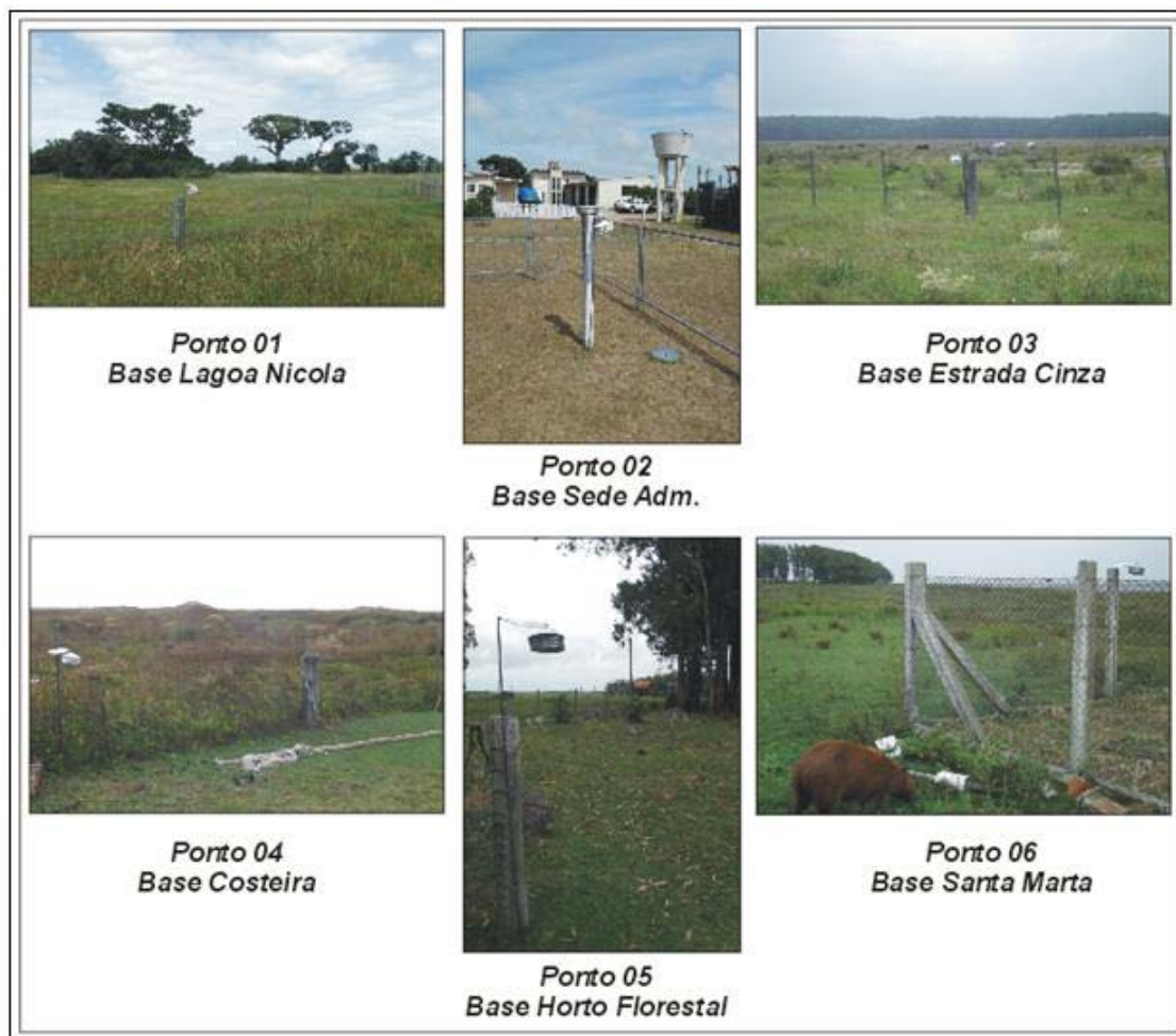
Figura 4 – Paisagens dos ambientes onde foram instalados os miniabrigos meteorológicos