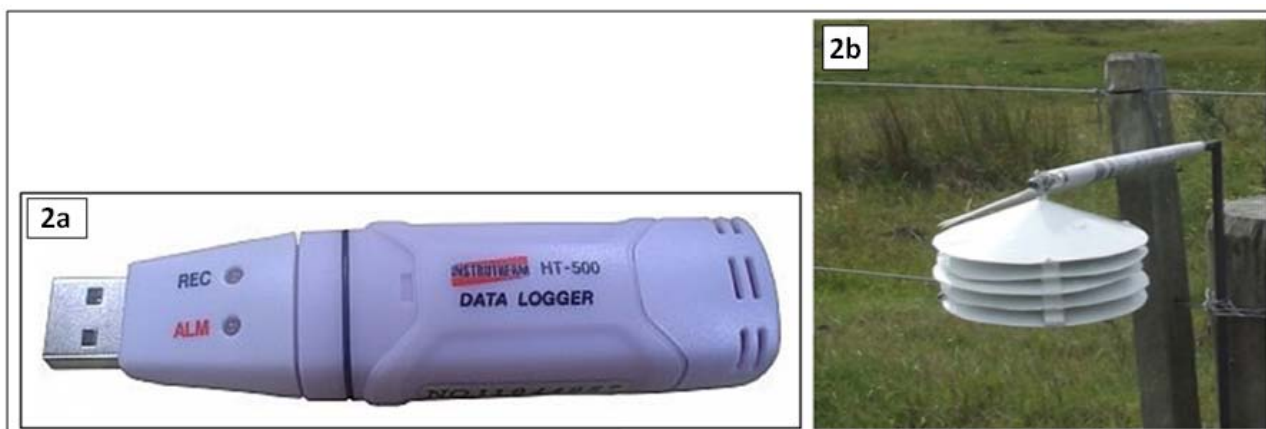
Figura 2b – Miniabrigo meteorológico de baixo custo.

Após a aquisição dos Dataloggers e confecção dos miniabrigos meteorológicos, deu-se a realização de 03 (três) trabalhos de campo na Estação Ecológica do Taim/RS sendo que no primeiro trabalho de campo, o primeiro ocorrido no final de fevereiro de 2013, foram instalados os miniabrigos meteorológicos, sendo selecionados 06 (seis) pontos distintos dentro da ESEC Taim (Figura 03), os quais correspondem às bases de segurança e pesquisa da Unidade de Conservação (UC).