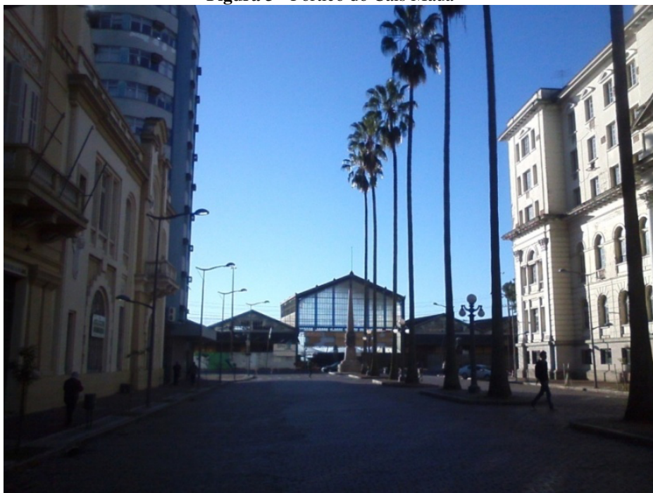
Figura 3 - Pórtico do Cais Mauá

Esses apontamentos condizem com a ideia de “territórios cíclicos” (SOUZA, 2008, p. 89; 2013, p.106), mutáveis conforme os horários dia, porque mudam as pessoas que os produzem. Ainda que permaneça a mesma materialidade de poucas horas atrás, e que seguirá posteriormente, as relações transformaram-se e, com elas, o território. Pois, como dito inicialmente, ele não é uma coisa, ainda que os objetos sejam expressão dele e condicionem sua existência.