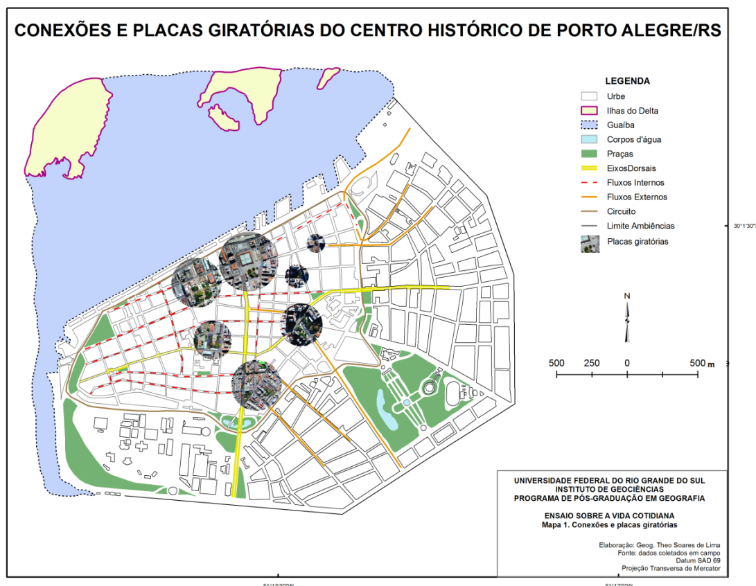
Figura 1 - Conexões e placas giratórias