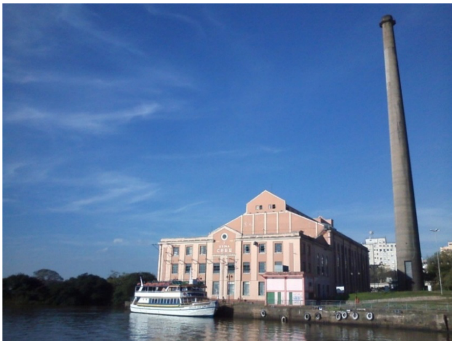
Figura 4 - Usina do Gasômetro

Um último caso de choque de territorialidades, que gostaria de mencionar porque compõe o diverso quadro escalar das tensões sociais, é o empreendimento de “revitalização” do Cais Mauá (Figura 3). A área costeira, que abarca o extremo Norte e Oeste do bairro Centro Histórico, é ocupada pelos armazéns do Cais até a Usina do Gasômetro (Figura 4). Toda esta área, pela presença do Guaíba, seja ele lago ou rio 10 , tem seus usos atrelados à amplitude da paisagem: observar o pôr do sol, tomar mate à brisa local, passear ao longo da orla e assim por diante.